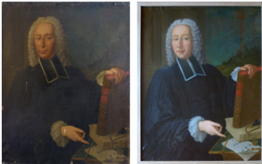
Le portrait de Grandjean de Fouchy avant et après restauration

Au terme d'une intervention d'environ un mois réalisée dans l'atelier de la restauratrice Elisabeth Chauvrat, le tableau est revenu littéralement transformé comme on le voit ci-dessous :