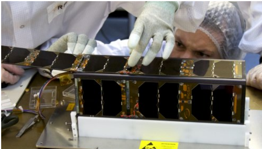
Intégration du nanosatellite PicSat à l'Observatoire de Paris - PSL

PicSat sera lancé ce 12 janvier 2018 pour étudier en continu l'étoile Beta Pictoris, son exoplanète et son célèbre disque de matière, grâce à un télescope de 5 cm de diamètre. Ce nanosatellite a été conçu et construit en trois ans seulement par des chercheurs et ingénieurs de l'Observatoire de Paris et du CNRS, avec le soutien de l'Université PSL, du CNES, de l'ERC et de la FONDATION MERAC.