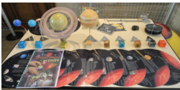
Mallette pédagogique "Système Solaire" UFE - Observatoire de Paris

Cet astronome de l'Observatoire dispose de malles pédagogiques et apportera un support scientifique et des conseils lors de rencontres ou entretiens par téléphone ou courriel.