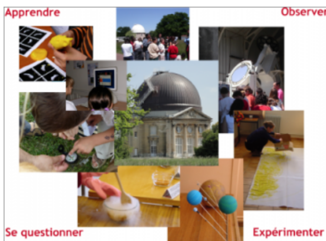
UFE - Observatoire de Paris

Un parrainage peut inclure une visite gratuite de l'Observatoire, une intervention du parrain dans l'école (conférence, séance de questions réponses, atelier), ou une initiation à l'observation du ciel. L'astronome viendra alors avec un petit instrument pour une séance d'observation nocturne ou du Soleil.