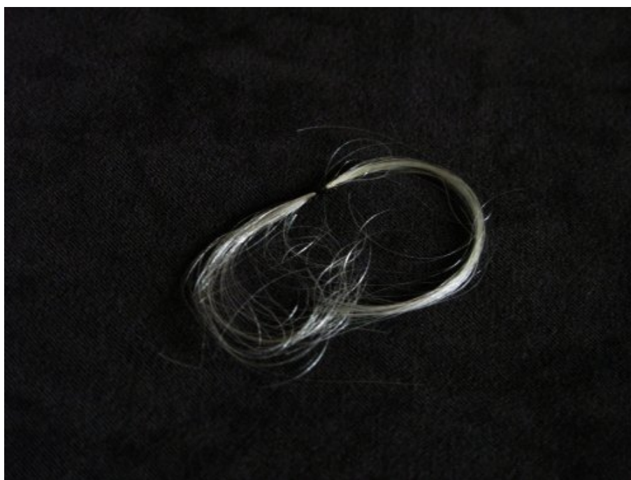
La mèche de cheveux de Newton, Ms 1071/3

La mémoire de Newton, comme celle de Galilée, a été célébrée par la conservation de "reliques", pieusement prélevées et conservées. La figure du savant rejoint ainsi celle du saint dans la mémoire collective. Comme toutes les reliques, dérobées, transmises, données, vendues, la mèche de cheveux de l'Observatoire a une longue histoire.