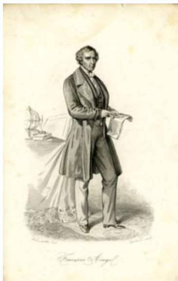
François Arago (portrait en pied) - gravure de A.Lacauchie (dessin), Buland (gravure), moitié du 19e siècle. Coll. Observatoire de Paris, inv.I.1889. Achat, 2015

l'acquisition d'un manuscrit de Charles Trépied (1845-1907), premier directeur de l'Observatoire d'Alger, sur la photométrie des étoiles.