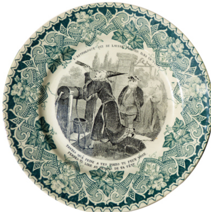
Assiette ronde avec scène imprimée en noir sur fond blanc représentant un astronome en train d'observer à une lunette au bord d'un puits et décor végétal imprimé en vert sur fond blanc - Manufacture de Lunéville, moitié du 19e siècle. Coll. Observatoire de Paris, inv.529. Don Suzanne Débarbat, 2015