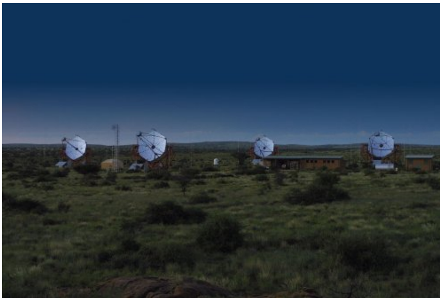
Les télescopes HESS au crépuscule, se préparant pour les opérations de nuit

cartographier les objets astronomiques en lumière gamma.