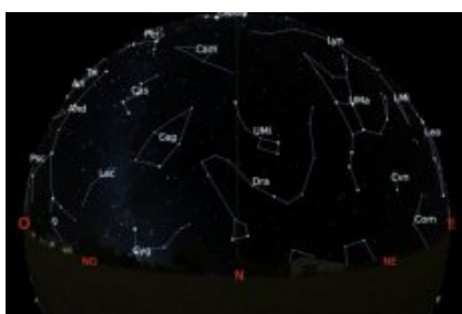
Carte du ciel en direction nord - janvier 2019

Ces cartes du ciel montrent les étoiles brillantes et les planètes visibles dans le ciel de l'hémisphère nord, vers l'horizon sud et vers l'horizon nord, pour le 15 janvier 2019 (23h). Le trait vertical correspond à la projection sur le ciel du méridien du lieu. L'arc de cercle rouge sur l'horizon sud représente l'écliptique (lieu de la trajectoire apparente du Soleil durant l'année).