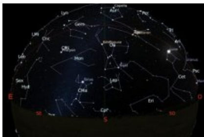
Carte du ciel en direction sud - janvier 2019