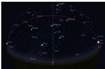
Carte du ciel en direction sud - janvier 2016