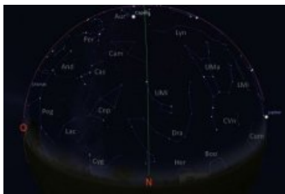
Carte du ciel en direction nord - janvier 2016

Ces cartes du ciel montrent les étoiles brillantes et les planètes visibles dans le ciel de l'hémisphère nord, vers l'horizon sud et vers l'horizon nord, pour le 15 janvier 2016 (23h). Le trait vertical correspond à la projection sur le ciel du méridien du lieu. L'arc de cercle rouge sur l'horizon sud représente l'écliptique (lieu de la trajectoire apparente du Soleil durant l'année).