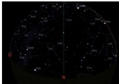
Carte du ciel en direction nord - décembre 2015

Ces cartes du ciel montrent les étoiles brillantes et les planètes visibles dans le ciel de l'hémisphère nord, vers l'horizon sud et vers l'horizon nord, pour le 15 décembre 2015 (23h). Le trait vertical correspond à la projection sur le ciel du méridien du lieu. L'arc de cercle rouge sur l'horizon sud représente l'écliptique (lieu de la trajectoire apparente du Soleil durant l'année).