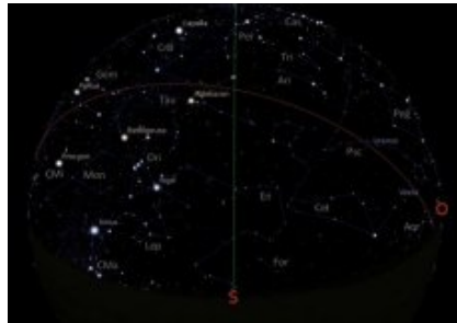
Carte du ciel en direction sud - décembre 2015