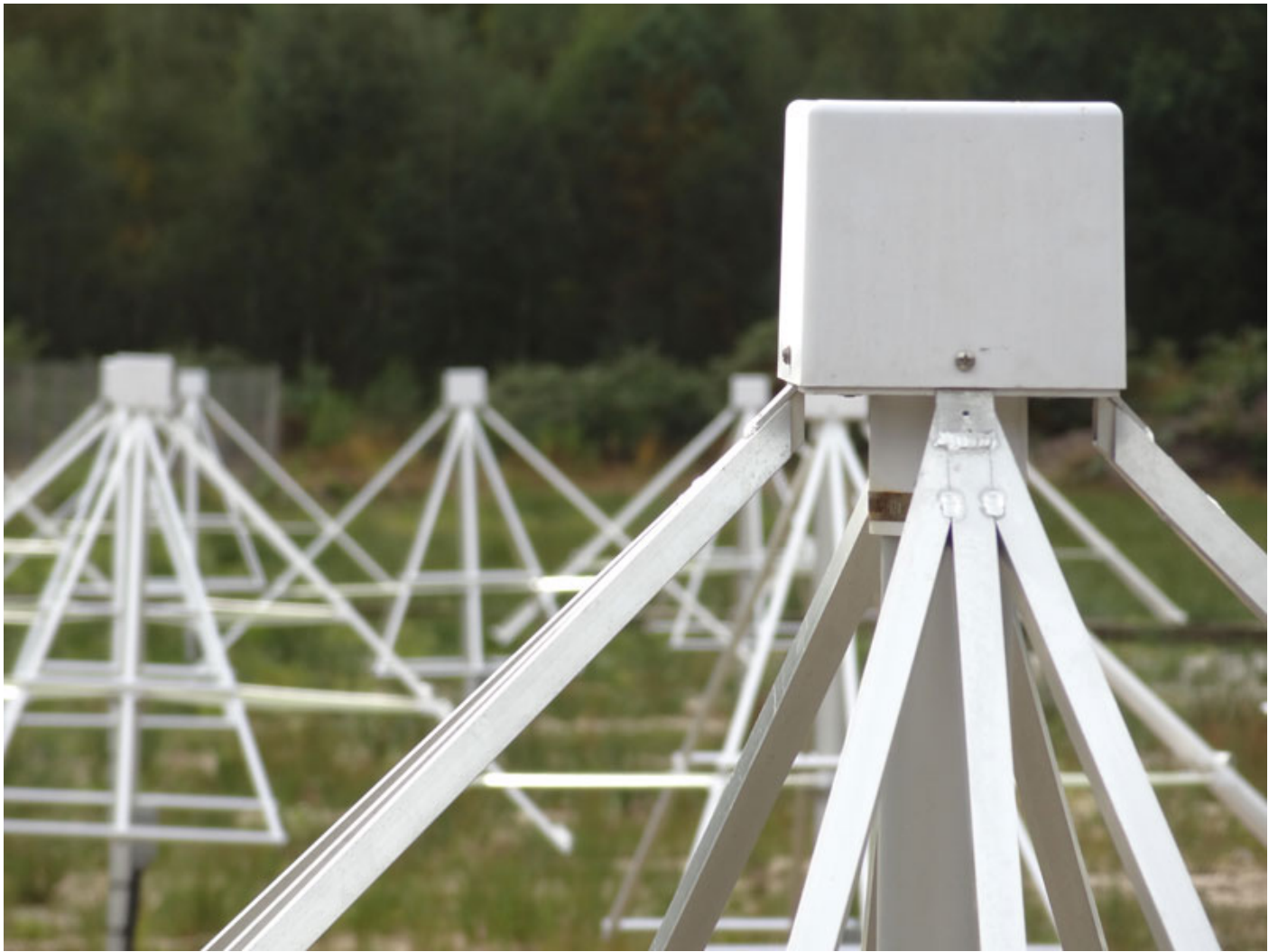
Antennes du réseau NenuFAR

La combinaison des signaux de ces antennes, et leur traitement dans un ensemble électronique dédié, permettront à NenuFAR de fonctionner simultanément et indépendamment comme deux instruments :