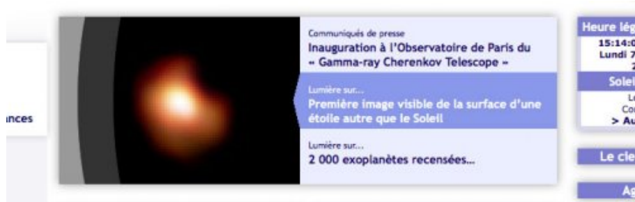
Page d'accueil version française