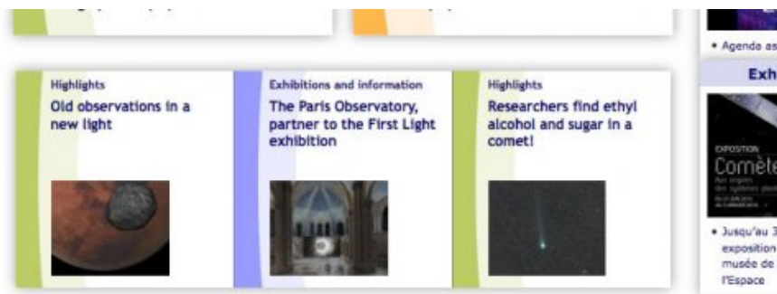
Affichage avec la version anglaise

Ne se fait que sur l'article en version française. Ce qui nécessite qu'une version anglaise EXISTE OBLIGATOIREMENT sinon la page de Une de la version anglaise affichera une case vide.