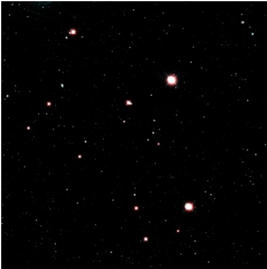
Image optique de la même zone céleste montrant de nombreuses étoiles et galaxies.